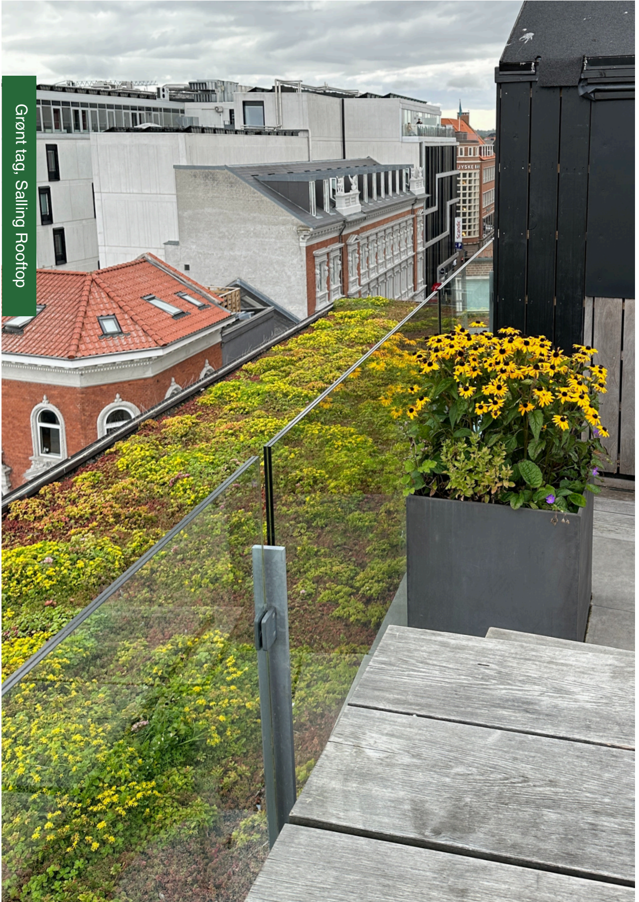
Grønt tag, Salling Rooftop